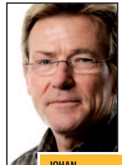
JOHAN VAN OVERTVELDT

Mijn overstap van de journalistiek naar de politiek kwam voor velen als een verrassing. Mijn enige drijfveer daarbij was diepe persoonlijke overtuiging die uit twee elementen bestaat. Enerzijds is er het besef dat het beleid in België en in Europa steeds meer tekort schiet in functie van de belangen van de burgers. Anderzijds is er het gegeven dat de N-VA met haar programma een antwoord biedt op de vele uitdagingen die ons de komende jaren te wachten staan. Het was uiteindelijk onvermijdelijk om die twee gegevens bij elkaar te brengen.